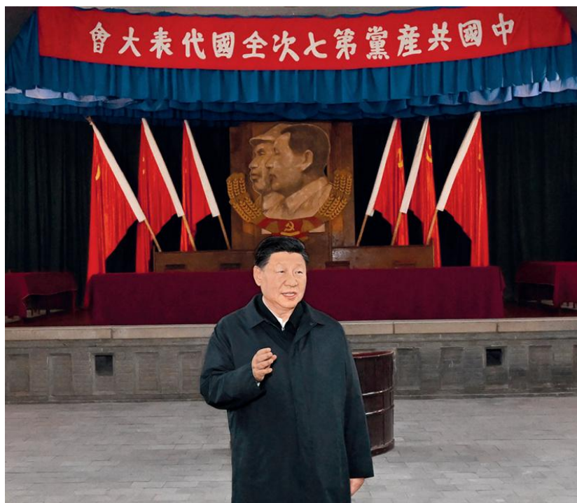
2022年10月27日，中共中央总书记、国家主席、中央军委主席习近平

第三，这是深入推进全面从严治党、以党的自我革命引领社会革命的必然要求。治国必先治党，党兴才能国强。全面从严治党永远在路上，党的自我革命永远在路上，解决大党独有难题是一个长期而艰巨的过程，既需要常抓不懈，又需要集中发力，及时消除一切影响党的先进性纯洁性的因素，清除一切侵蚀党的肌体健康的病毒，确保党永远不变质、不变色、不变味。