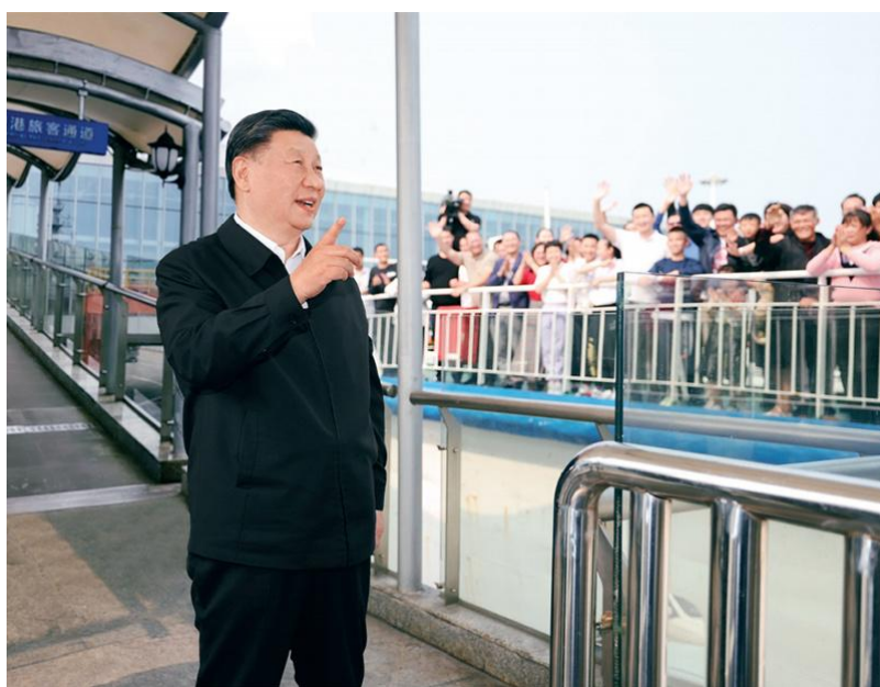
2023年4月10日至13日，中共中央总书记、国家主席、中央军委主

史进程和伟大变革，深刻把握新时代中国特色社会主义思想产生和发展的实践基础；紧密结合统揽伟大斗争、伟大工程、伟大事业、伟大梦想，统筹推进“五位一体”总体布局、协调推进“四个全面”战略布局的时代要求，深刻把握这一思想关于治国理政的新理念新思想新战略；紧密结合工作职责需要，深刻把握这一思想关于相关领域的重要论述以及做好具体工作的思路、举措、办法。把全面学习和重点学习结合起来，引导广大党员、干部坚持干什么就重点学什么、缺什么就重点补什么，增强学习的针对性，努力提高学习实效。各级党委（党组）要采取理论学习中心组学习、举办读书班等多种形式开展集中学习、深入研讨交流。领导干部要上讲台、讲党课，以身作则、以讲促学。坚持以党内教育引导和带动全社会的学习，让党的创新理论“飞入寻常百姓家”。