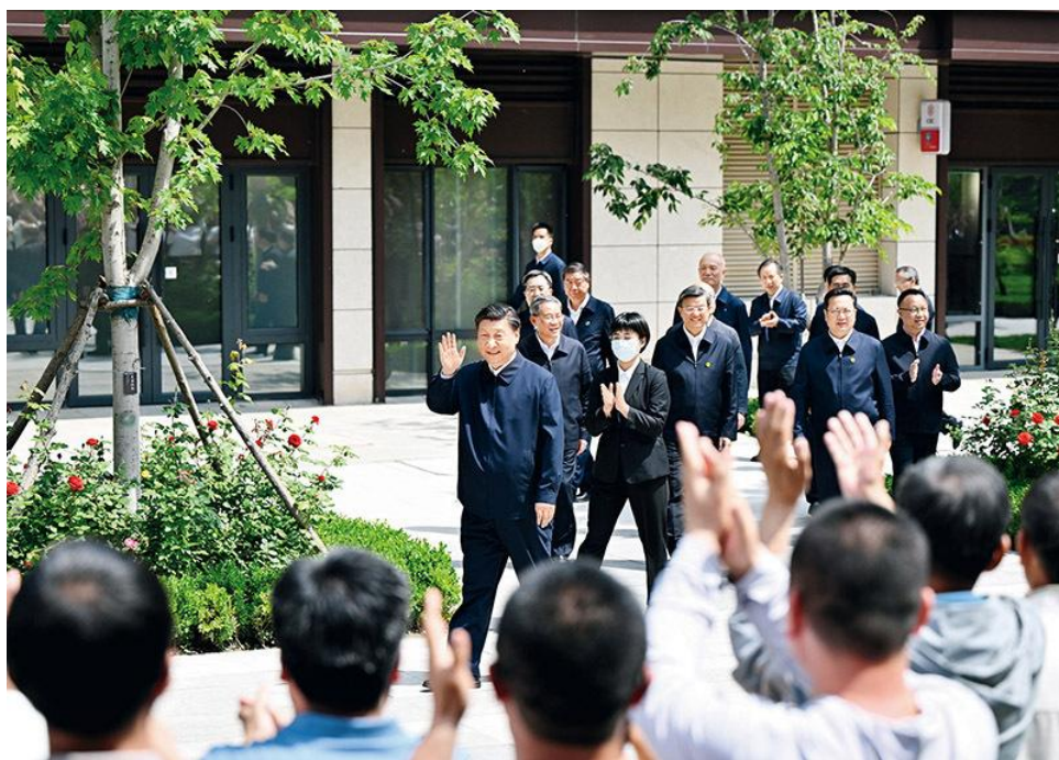
2023年5月10日，中共中央总书记、国家主席、中央军委主席习近平

破，强化政治领导，丰富战略支撑，拓展实践路径，破解发展难题，激发动力活力，使中国式现代化的中国特色更加鲜明、优势更加彰显、前景更加光明。要善于运用这一思想解决经济社会发展中的各种矛盾和问题，完整、准确、全面贯彻新发展理念，加快构建新发展格局，推动高质量发展，促进共同富裕。要善于运用这一思想防范化解重大风险，增强忧患意识，坚持底线思维，居安思危、未雨绸缪，时刻保持箭在弦上的备战姿态，下好先手棋，打好主动仗，对各种风险见之于未萌、化之于未发，坚决防范各种风险失控蔓延，坚决防范系统性风险。要善于运用这一思想深入推进全面从严治党，时刻保持解决大党独有难题的清醒和坚定，既注重解决好出现的新问题，又注重解决好存在的深层次问题，确保党永远不变质、不变色、不变味。